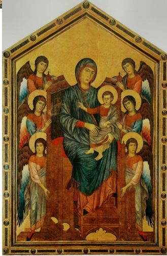
Maestà, Cimabue (Itália 1240-1302).