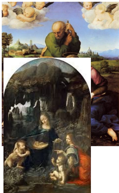
A sagrada família Canigiani, Rafael (Itália, 1483-1520).

Isso aconteceu em um período chamado Renascimento, cujos princípios fundam-se na retomada dos valores e conceitos artísticos Greco-romanos, humanismo, ou seja, o ser humano como centro (antropocentrismo), e não mais Deus (teocentrismo), como foi no período medieval que precedeu. A mimese grega contou no renascimento com o desenvolvimento do desenho e da pintura em perspectiva, com o esfumado para dar volume às pinturas, assim como dos estudos racionais da natureza, a partir da observação da paisagem e da anatomia humana. Você possivelmente já ouviu falar de Rafael, Leonardo da Vinci, Donatello e Michelangelo. Todos são artistas renascentistas e passaram por academias italianas. Observe uma obra de cada um.