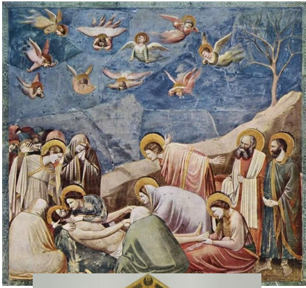
A lamentação de Cristo, Giotto (Itália, 1267-1337).